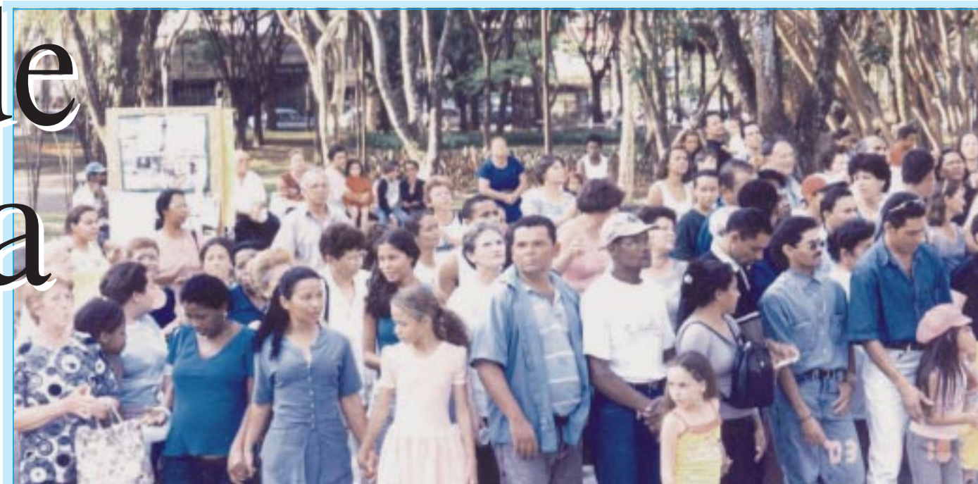
Público acompanha as apresentações realizadas no palco do Ipiranguinha, em Santo André

Santo André exhibe talentos no 1º Encontro dos Alunos do MOVA